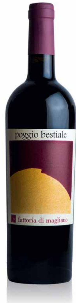
Fattoria di Magliano, Magliano Poggio Bestiale 2013

Vielleicht einer der besten Ciliegiole der Küste: Camillo pflegt diese Einzellage mit ihren 50 Jahre alten Reben seit 2006. Der Wein reift ein Jahr in grossem Holz und duftet nach Trockenblumen und frischen Kirschen; im Mund vereint er Balance mit Eleganz und Länge. Probieren!